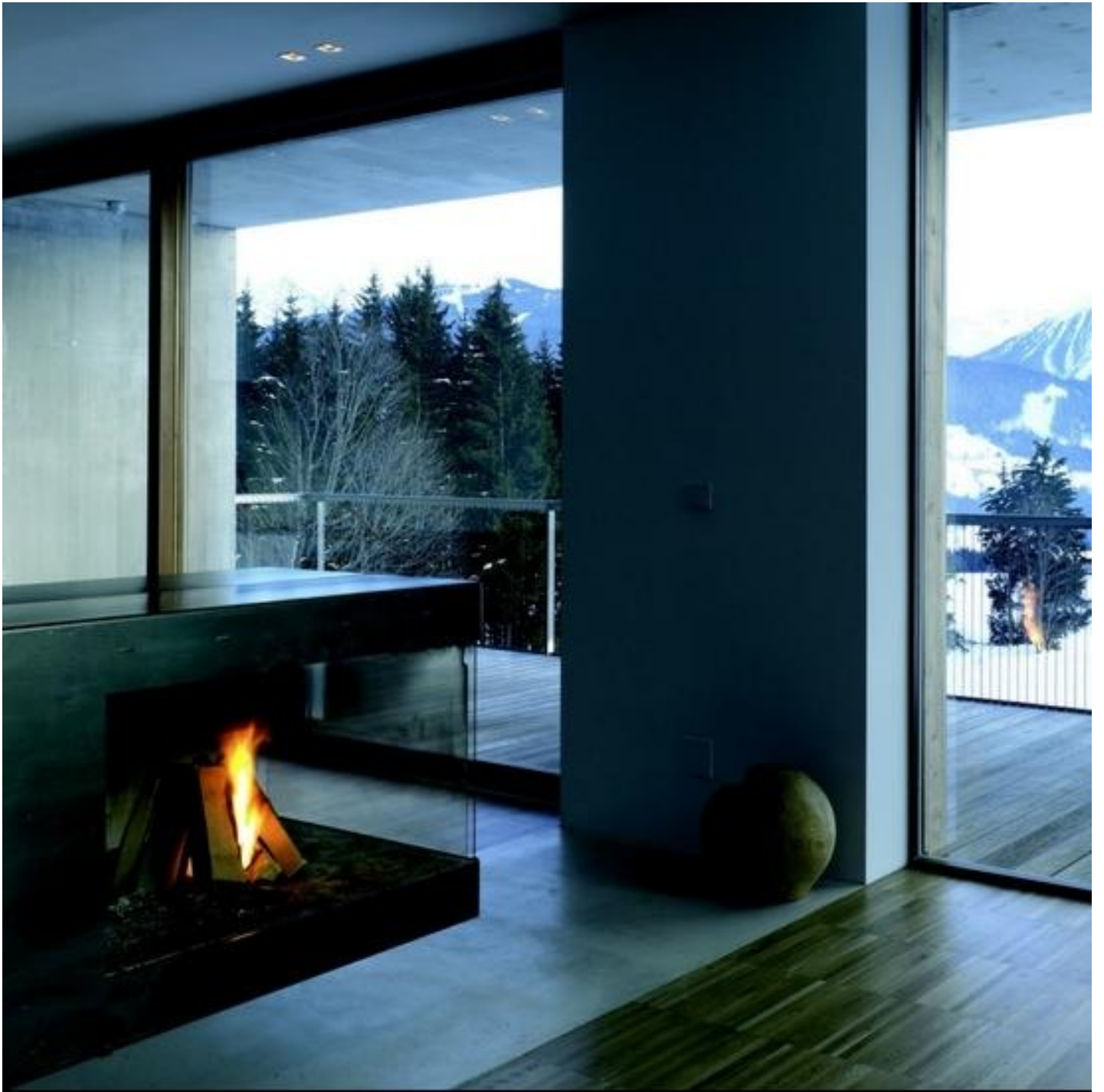
SGG PLANITHERM XN/XN II