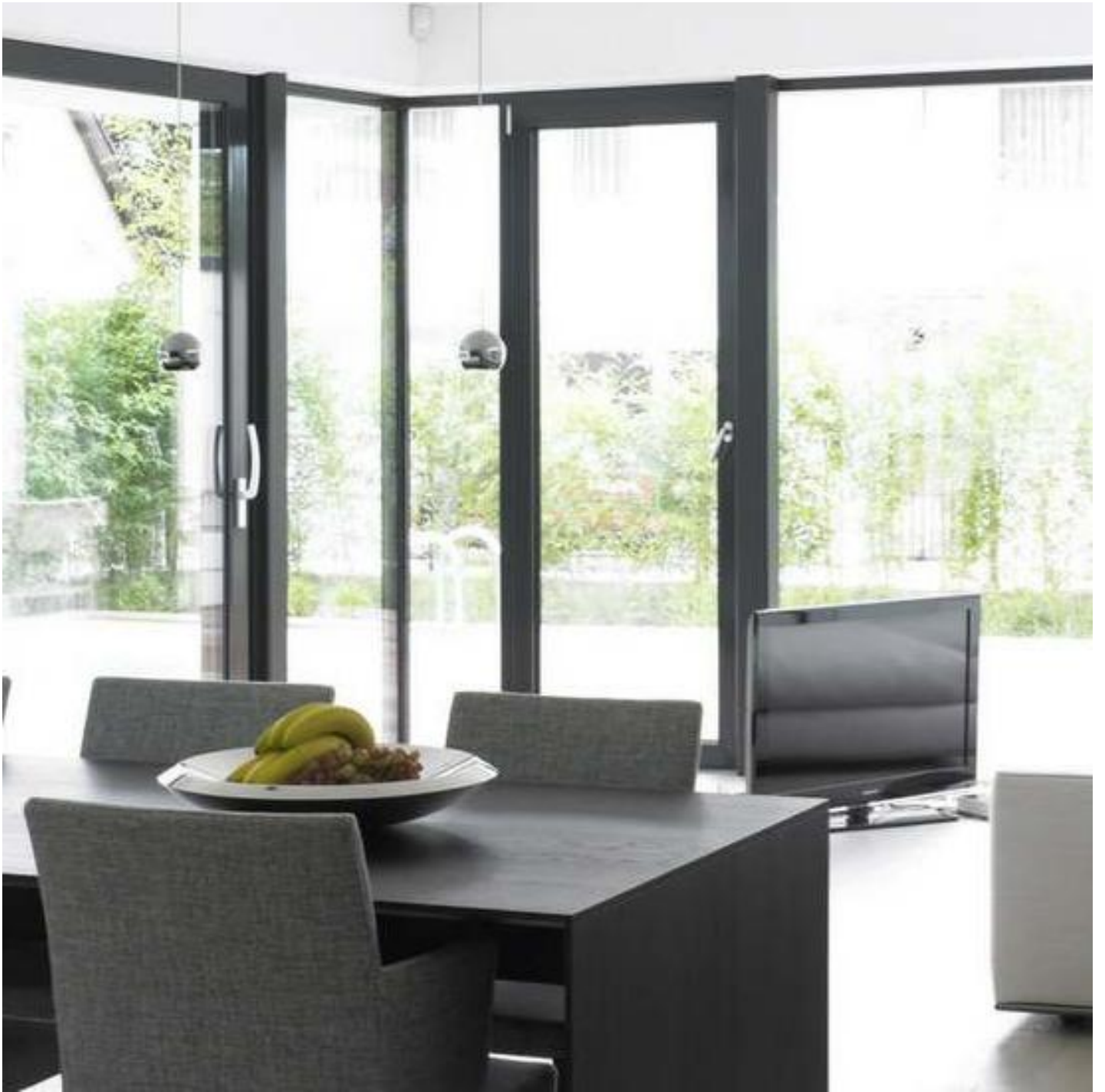
SGG PLANITHERM 4S